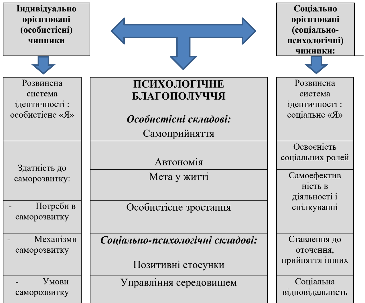
Рис. 1.1. Теоретична модель детермінації психологічного благополуччя особливостями особистісної зрілості

обґрунтувати роль цього феномену в забезпеченні психологічного благополуччя.